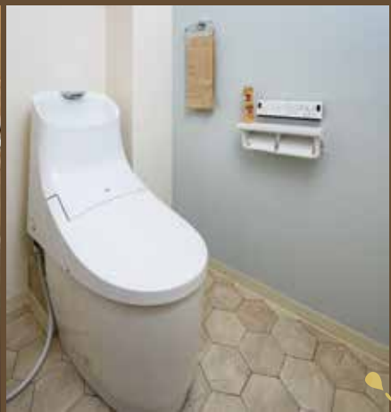
※掲載の写真は2021年7月に撮影したもので、家具調度品は販売価格に含まれておりません。